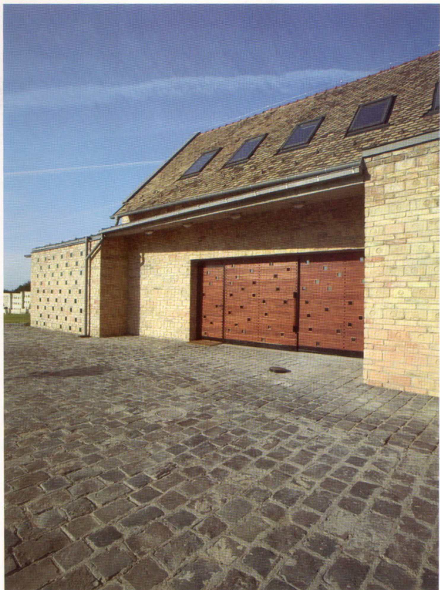
A „bortemplom” architektúráját a bontott téglá határozza meg. Négyzet alakú perforációk díszítik és jellemzik az épületegyüttest