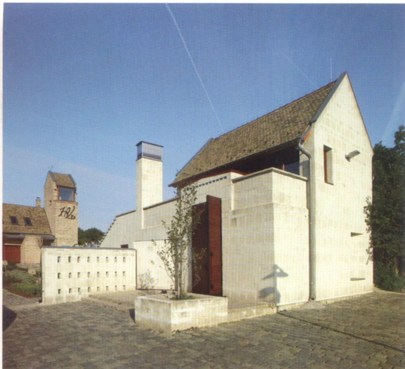
Az utca felé nyíló préház a borturizmust lehetővé tévő vendégfogadó hely. Templomot idéz a háttérben a gazdasági épület. A két építményt föld alatti pincerendszer köti össze

Gyönyörű hely Etyek. Biatorbágy után dombok között kanyargó úton érkezik meg ide az ember. Áthajt a falun, majd felkanyarog az Öreghegyre, és a vadszőlővel befuttatott pincék között egyszer csak megpillant egy téglából rakott tornyot... Az idén tavasszal megnyílt borászatnak, a magas kőkerítéssel körbezárt birtoknak első pillantásra van némi dél-amerikai jellege – ami nem is csoda, hiszen az egyik tulajdonos argentin.