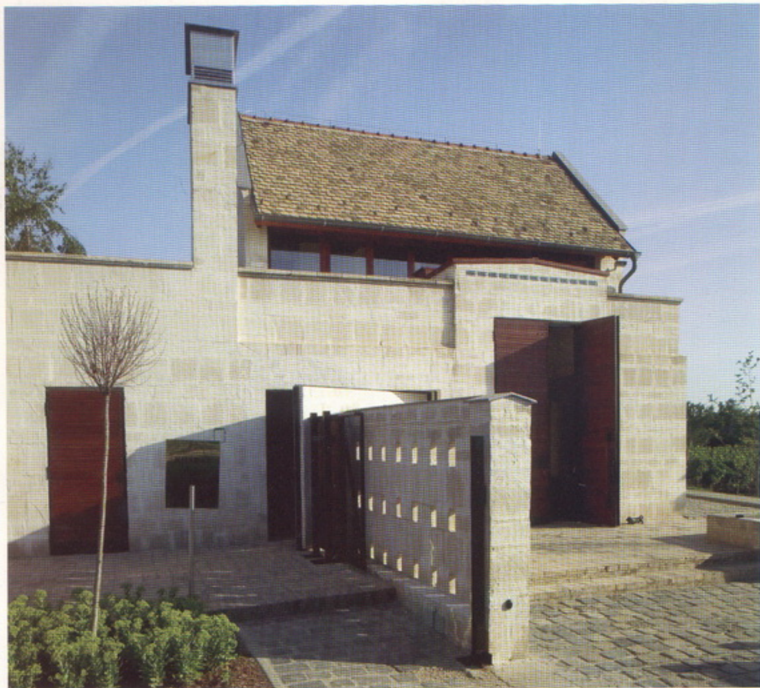
A telekhatárra illesztett présház világos mészkőhomlokzata a helyi pincehagyományok kortárs variációja. Külön izgalmas a kertéshez történő csatlakozása, ahol a két elem, vagyis ház és fal egyetlen kompozícióban szervesül

látó alatti szinten helyezkednek el az irodák, gyakorlatilag a „hajó” nyitott fedélszékes tetőterében. Az irodák alatt, a tulajdonképpeni földszinten van a palackozó. Hogy az irodai tevékenység és az alatta zajló manipulációs munka ne különüljön el teljesen, a két szint közé acélgerendákkal alátámasztott üvegpadlót építettek be. Az irodák szintjén a három utolsó gerendaállást leválasztotta az építész, s ezzel verandát alakított ki, ahonnan újra kitekinthet az ember a környező dombokra. A palackozóterem egyik fala szintén üveggel nyílik meg a telek mellett kezdődő szőlő felé. Ezen a részen,